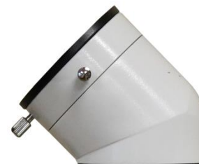
urządzenie do przedłużania obrotu