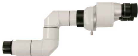
Dodatkowa głowica nauczania